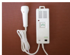
緊急通報装置 (ナースコール)